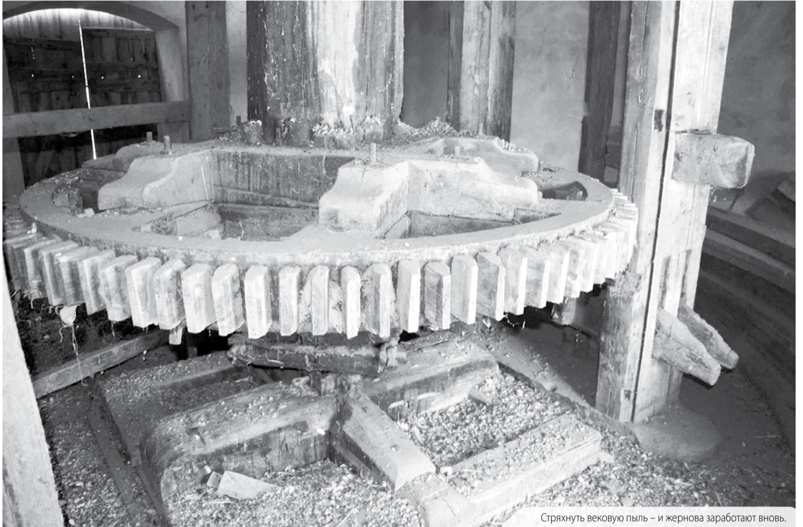
Стряхнуть вековую пыль – и жернова заработают вновь.

...Примерно такую пасторальную картинку рисует воображение, когда