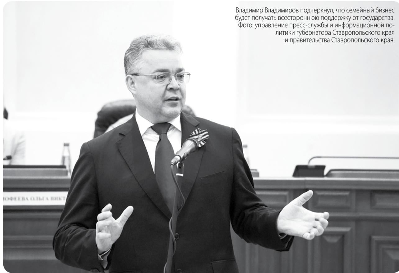
Владимир Владимирович подчеркнул, что семейный бизнес будет получать всестороннюю поддержку от государства.

Более ста представителей семейных компаний из 27 регионов собрались в Ставрополе, чтобы познакомиться с передовым опытом семейного предпринимательства.