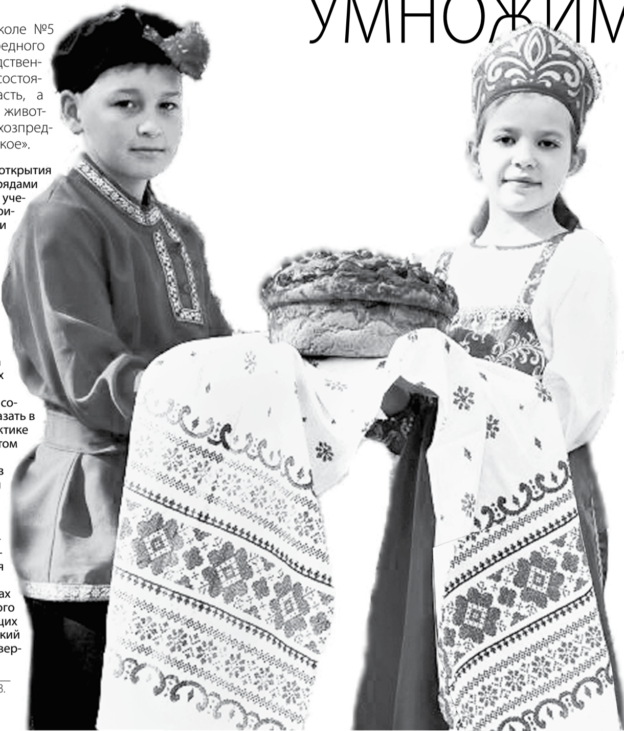
Гостей и участники слёта ученических производственных бригад в школе №5 села Новоблагодарное встречали хлебом-солью