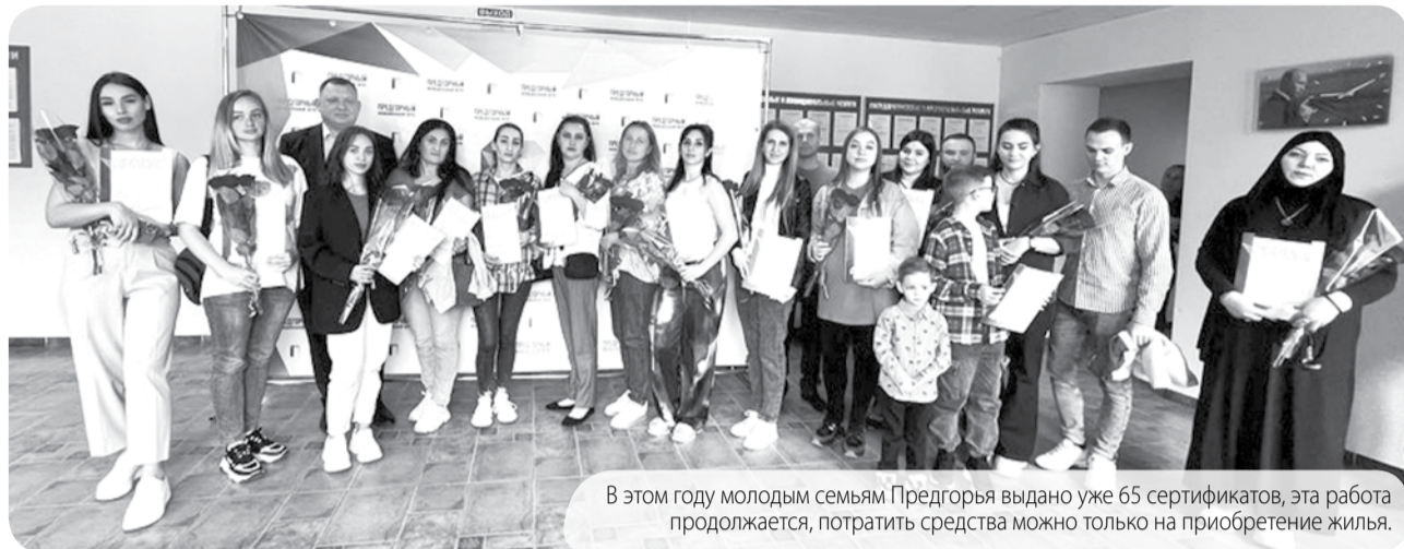
В этом году молодым семьям Предгорья выдано уже 65 сертификатов, эта работа продолжается, потратить средства можно только на приобретение жилья.

В Предгорном округе прошло очередное вручение сертификатов на улучшение жилищных условий молодым семьям.